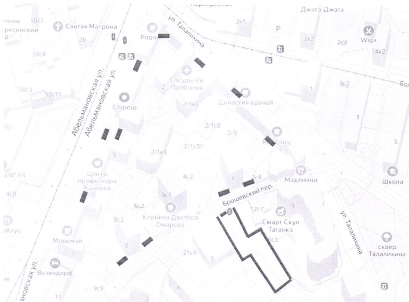
Схема установки ограждающих устройств по адресам: г. Москва, ул. Абельмановская, д. 3, 5, 7; ул. Талалихина, д. 2/1, корп. 1, 4, 5, 6; д. 6, стр. 1, 2; д. 6-8/2, стр. 3; Брошевский пер., д. 4, 8

Приложение к решению Совета депутатов муниципального округа Таганский 28 ноября 2023 года № 10-1/89